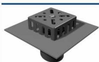
moravka® - B

Wykonanie wpust ze stali nierdzewnej z odpływem pionowym oraz kolnierzem drenującym Rozmiar kraty z ramą 300x300mm Odpływ średnica rury DN 150mm długość rury po zastosowaniu kształtki dowolna