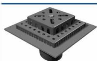
moravka® - A

Wpusty mostowe znajdują zastosowanie w budownictwie mostowym. Zadaniem wpustu mostowego jest zbieranie wody z poziomu nawierzchni hydroizolacji płyty pomostowej.